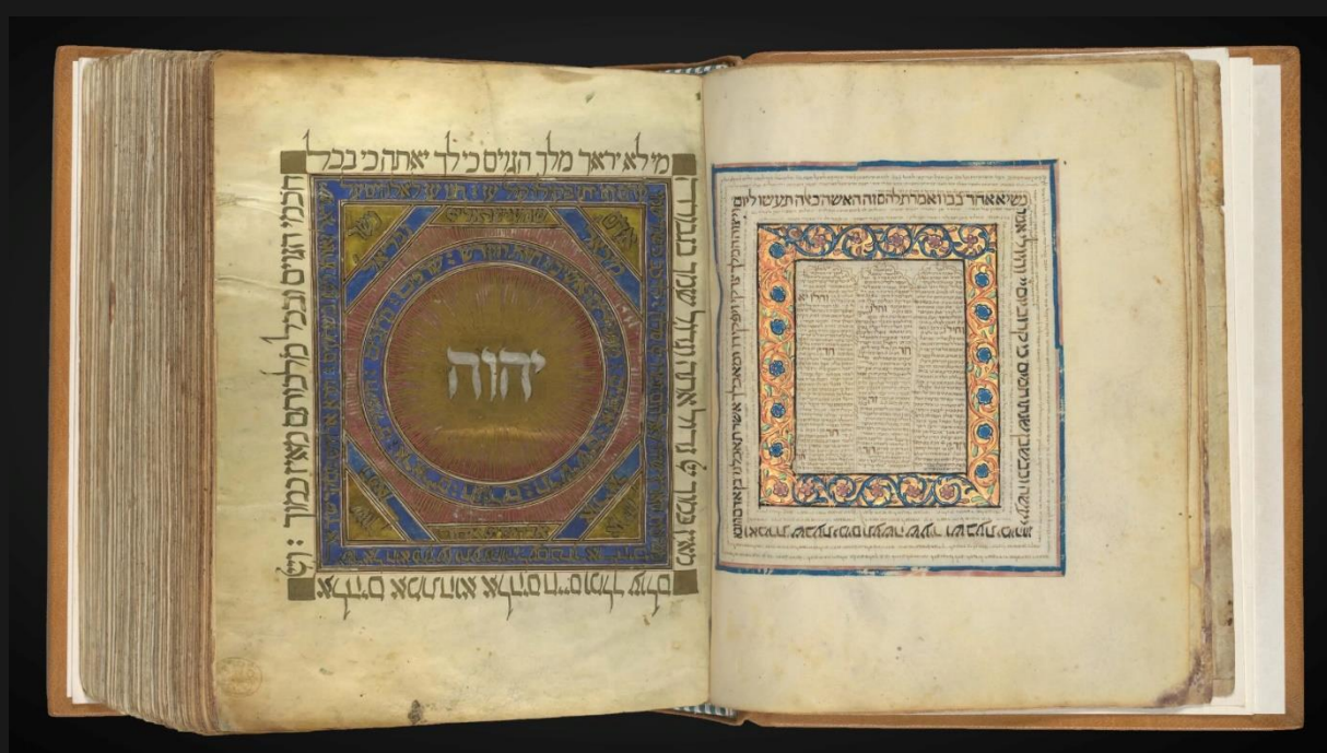
Sagradas Escrituras hebraicas, datada de 1384, contendo o Nome do Criador.

“O seu Nome permanecerá eternamente, o seu Nome se irá propagando de pais a filhos enquanto o sol durar e os homens serão abençoados Nele.” Salmos 72:17